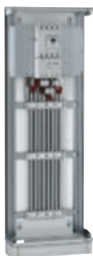
Barres en C réf. 4044 33 + Supports réf. 4044 60 + kit de raccordement réf. 4044 63

VX 3 OPTIMISÉE 800A, en armoire XL 3 800 et XL 3 4000