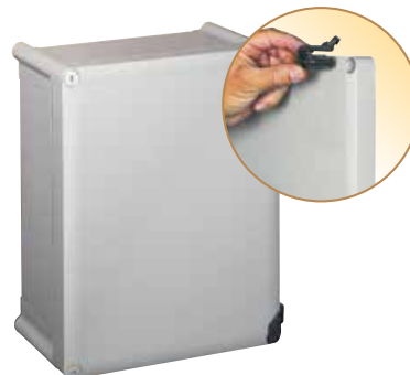
0350 44 mit Scharnier 0358 01