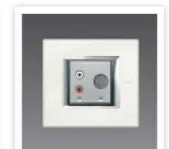
▶ Cinch-Eingang für den Anschluss einer externen Quelle S. 200