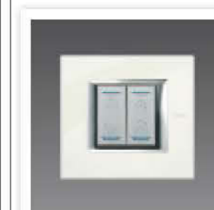
▶ Tastensensoren S. 200