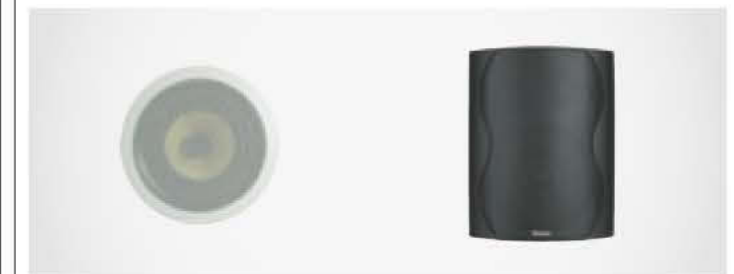
▶▶ Lautsprecher für alle Installationsarten