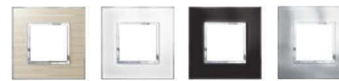
5717 31 Casual 5717 34 Mirror White 5717 37 Mirror Black 5717 40 Stainless Steel

Montageplatten S. 84, Mehrfachkombinationen S. 82