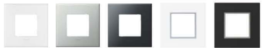
5717 00/01 Weiss 5717 10/11 Pearl Alu 5717 20/21 Graphite 5717 01WMR Weiss mit Zierrahmen silber 5717 01SZR Schwarz mit Zierrahmen silber

Montageplatten S. 84, Mehrfachkombinationen S. 82